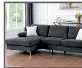
Garnitura Riva 263 x 132 x 77 cm