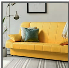
Ležaj Labud 198 x 90 x 95 cm