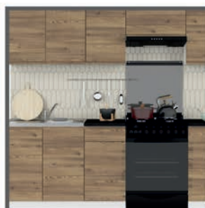
Kuhinja Junona 240 cm